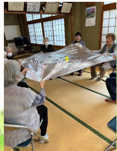
「ゲーム：ブラックホール」