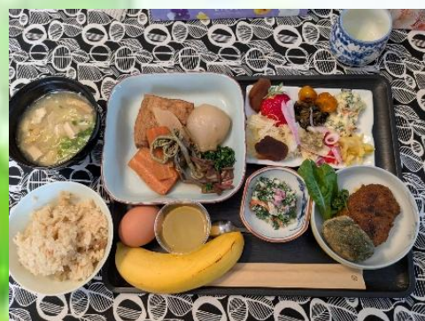
「最高の手作り料理☆」