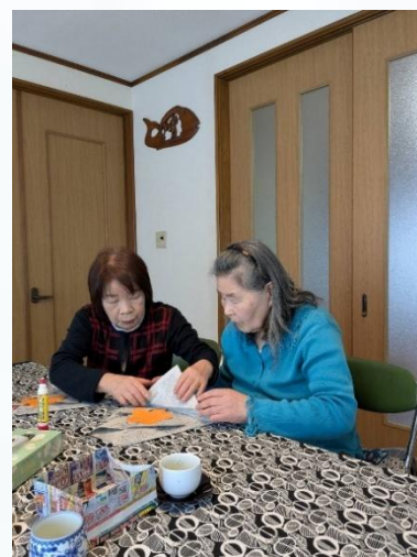
「集中して兜づくり」